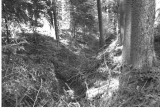
Hohlweg im Buechwald. Abb. 1 (, 2. 5. 1988)

Möglicherweise wurden die Hohlwege zuletzt als Forstwege (Reistlinien) benutzt. Dieser Verlauf über die Birchweid und den Buechwald dürfte als die Transitstrecke von Rapperswil nach Einsiedeln angesprochen werden. Die ursprüngliche Breite von 1 bis 1.5 m entspricht einem Saumweg, auch erlaubte der Seesteg (bis 1878, bis zum Bau des Dammes) keinen Karren- oder Wagenbetrieb.